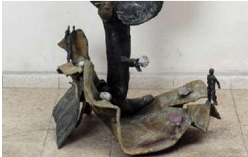
לא חשוב האיך, רק המה

התערוכה "בחזרה לעתיד" מחולקת על פני גלריות זימן ואופאל הסמוכות זו לזו. בזימן מוצגות מספר עבודות משנות ה-70, כמה מתוך סדרה העוסקת באיגרוף והיאבקות, וכן פסלי ברונזה מהשנים האחרונות. באופאל יש עשרות ציורים בנושאי "אקטואליה", המבוססים כולם על תצלומים מהעיתונות של השנים האחרונות. הרוב מוצג עכשיו לראשונה.