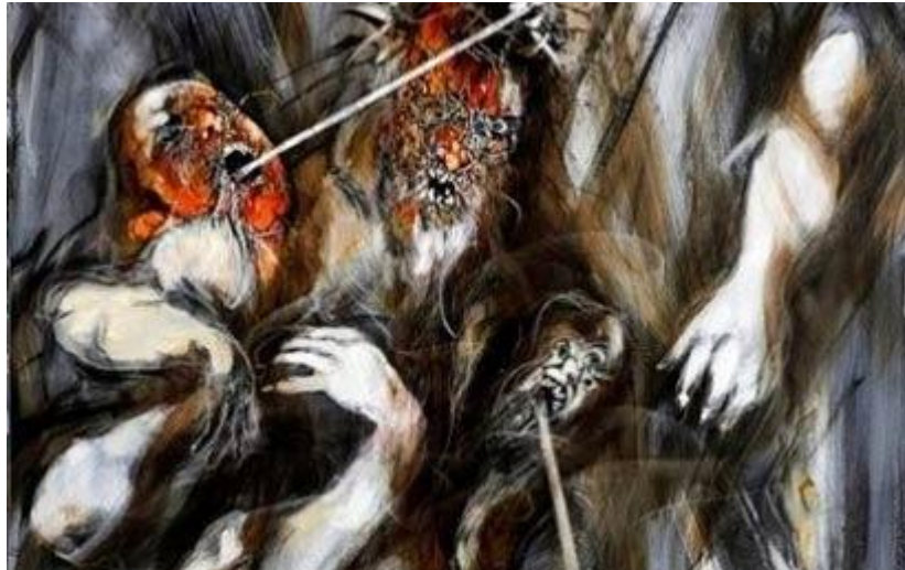
מלחמת עולם בין ידע למחשבה

על אף שהוא אדם נעים מזג ותקשורתי, נוכחותו חזקה ויש זיק של כוחנות גם בחזות שלו וגם בצורת הדיבור. "בידע אין מחשבה ובמחשבה אין ידע", הוא מסביר. "אנשים חושבים הולכים לעשות מדע, ומייצרים ידע, אבל ידע לא יכול לייצר מחשבה".