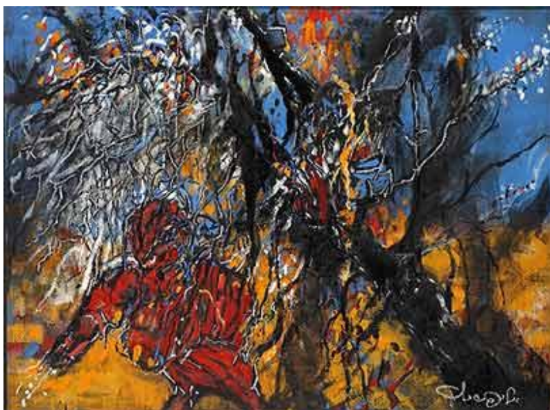
עבודה של ליפשיץ שהוצגה בתערוכה לפני כשנתיים

במשך כל שנות יצירתו הציג ליפשיץ תערוכות רבות בארץ ובעולם ועבודותיו נמצאות באוספים הגדולים בישראל. במהלך הקריירה זכה גם בפרסים רבים, ביניהם פרס קולב מטעם מוזיאון תל אביב (1965), פרס קרן ארסמוס (1966) ופרס דיזנגוף (1985).