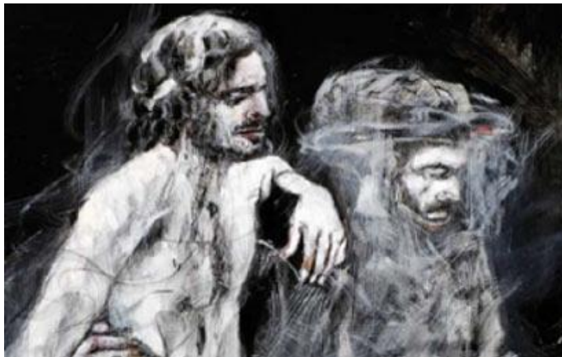
קדושה או אירוניה?

ליפשיץ דווקא טורח להפציר בבאי התערוכה לקחת את הכל בהומור. אני בוהה בציורים, כולם כהים, מדכאים, משיכות המכחול פרועות. באחד מהם אם עטופת-ראש ובתה משתופפות בחוצות רחוב חשוך, מתחת לכנפיה העצומות של ציפור בלהות שחורה בעלת מקור משונן. איך אתה מיישב הומור עם מראות כאלו? ליפשיץ מסביר שב"הומור" הוא איננו מתכוון לבדיחה אלא לספק. צריך להסתכל על הדברים האלו עם מידה של ספק.