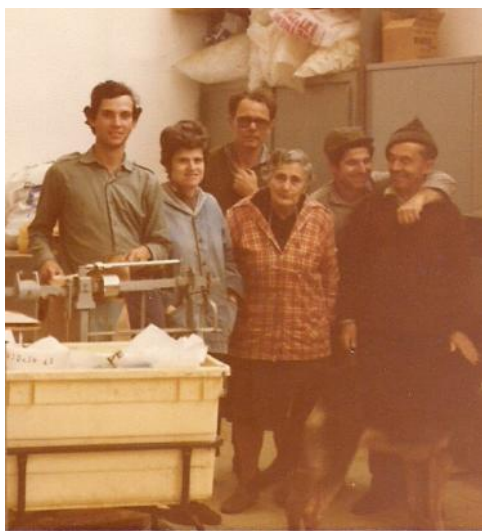
פועלת ייצור בקבוץ יקום. תמונה מ-1978.