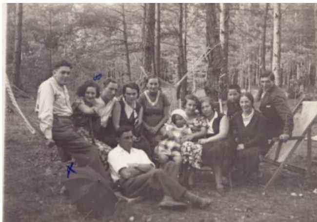
האחים לבית רוזנצוויג תמונות מלפני מלחמה.