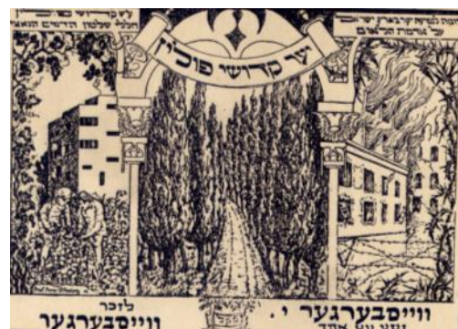
תעודה שניתנה לסבי על שנטע עץ ביער קדושי פולין.