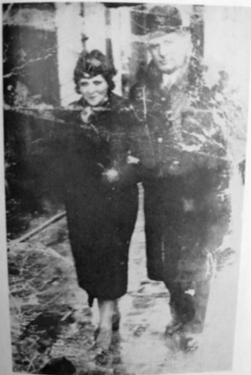
אחות של סאלווינת ינטיל הרטמאן ובעלה, ניסמו בביזאד'