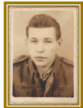
Bielawa 1949 (עם הקדשה לרחל בגב התמונה)