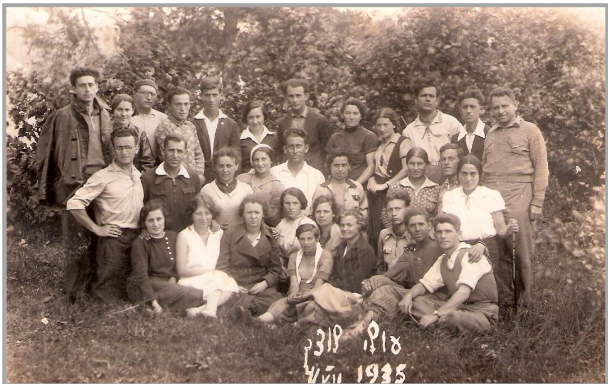
תמונה קבוצתית של פלוגת לוצק לפני העלייה ארצה, 1935.