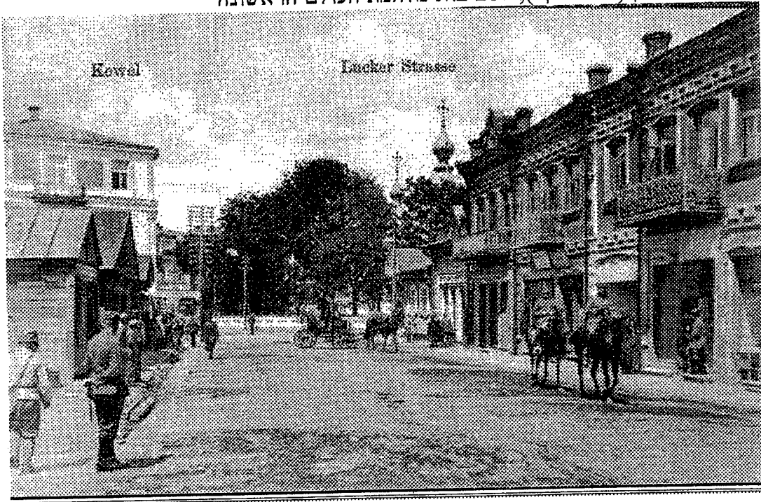
רחוב לוצק (ורשבסקה), בסביבות מלחמת העולם הראשונה