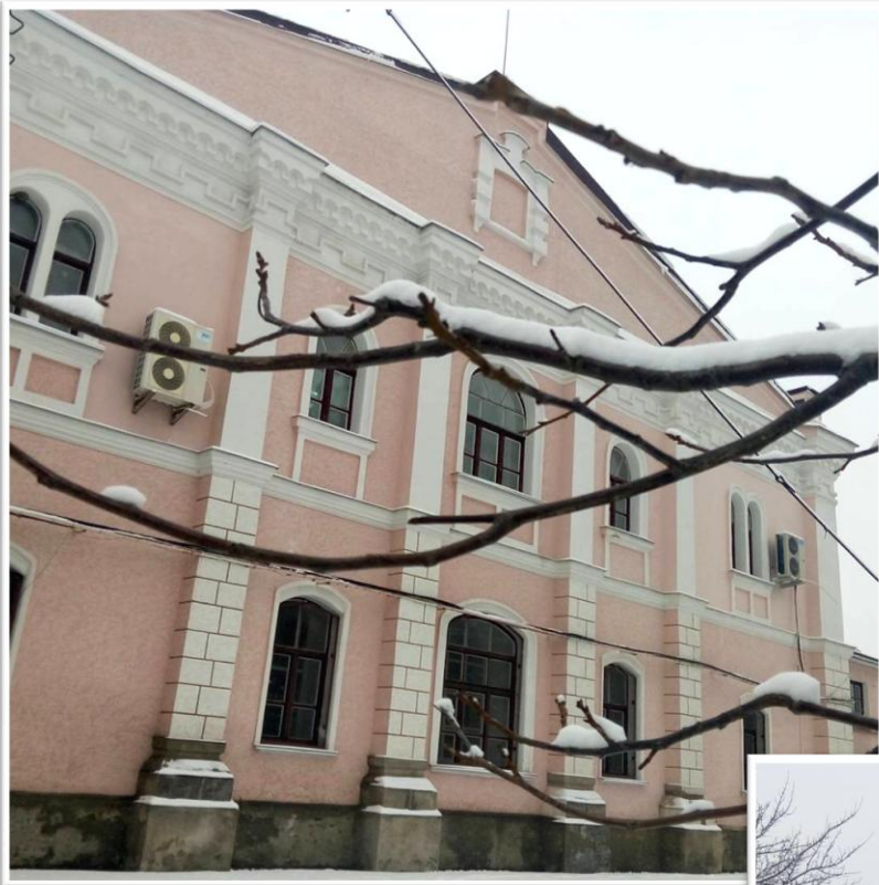
בית הכנסת הישן בקובל וגן המשחקים שמולו

למחרת היום אחרי ארוחה קלה יצאתי עם מפה לתור את מרכז העיירה ההיסטורי, שם ישבה הקהילה היהודית. היום אין זכר אמיתי לצד הזה בקובל. השלטים כולם באוקראינית והיות והיה יום שבת האנשים כולם היו בחוץ, עושים קניות לסוף השבוע בין היתר בשוק ירקות נייד שהותקן בתוך משאית. הורים גוררים ילדים על מזחלות וחתולים חומקים למפתני הדלתות החמימים. יכולתי לראות הצצה חטופה לילדותה של סבתי, שעד גיל עשרים גדלה ולמדה בקובל. היא תמיד היתה מספרת על קטיף הדומדמניות ופירות היער ביערות שליד קובל. כאלה אין אמנם בשלג העמוק, אבל דמיינתי אותם מנצים עם בוא האביב, לובשים חיים וצורה. האנשים ברובם היו חביבים ומאירי פנים. איני יודע מי מהם תושבי קובל מזה דורות ומי מהם אוקראינים שהתיישבו במקום אחרי מלחמת העולם. היה קשה לדמיין את הזוועות ההן מתבצעות שם, יום אחר יום.