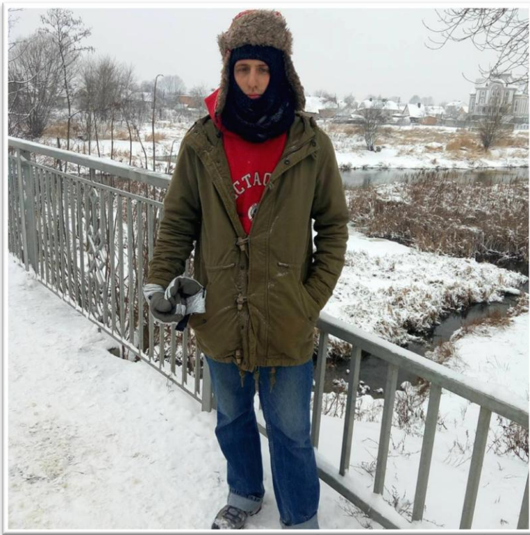
על רקע הנהר הקפוא של קובל