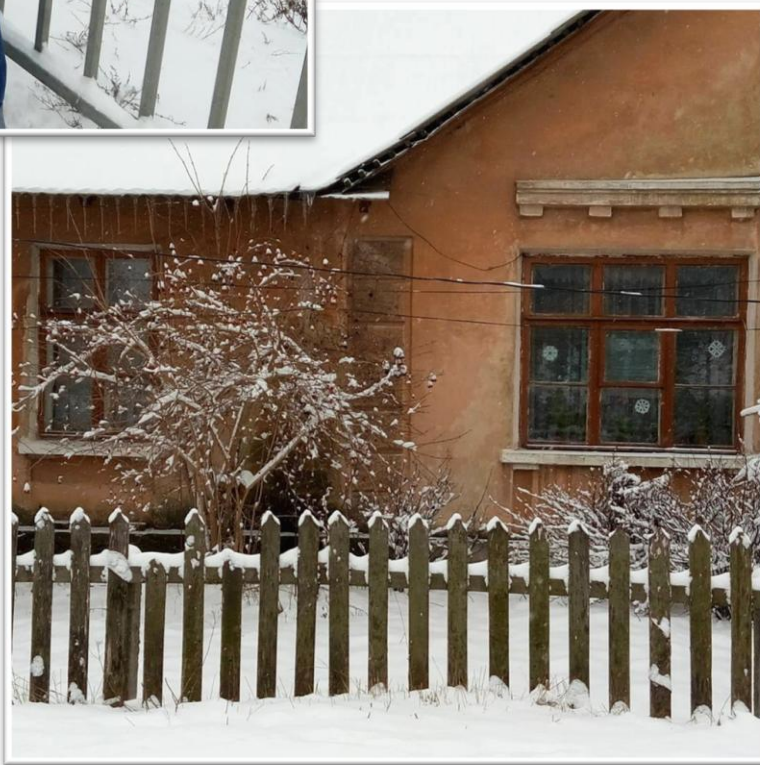
בית אגדות בקובל