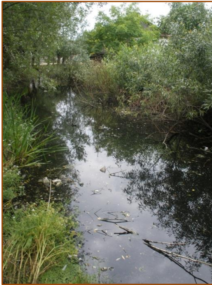
הפלג היוצא מנחל הטוריה ומקיף את העיר העתיקה (ליד השוק, רח' אפצ'נה לשעבר)