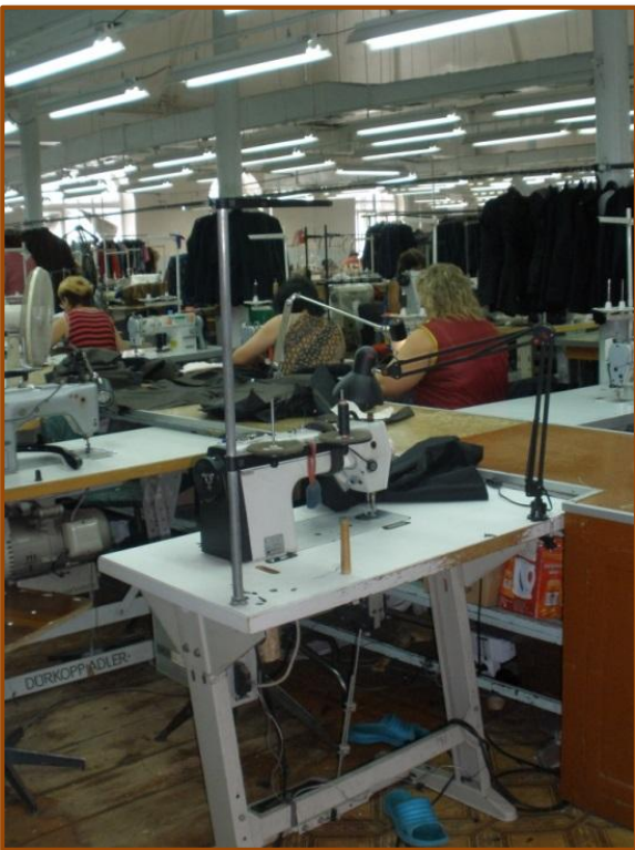
המתפרה שבקומה השניה של בית הכנסת. רצפת עזרת הנשים הושלמה לכל שטח בית הכנסת והפכה לאולם הייצור. הקומה הראשונה הפכה למחסן ולמשרדים.