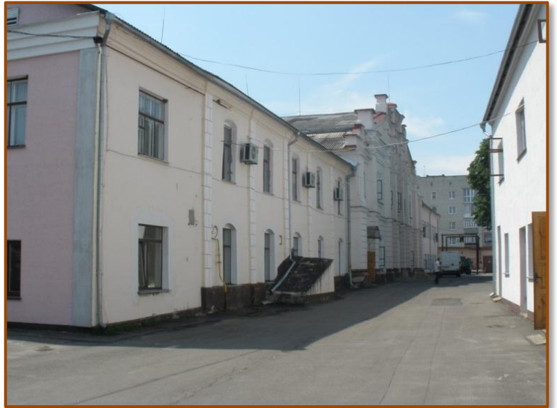
מתחם בית הכנסת הגדול (לשעבר) בקובל, המשמש כיום כמתפרה. המבנה הקרוב, הצמוד לבית הכנסת, נבנה לאחר המלחמה.