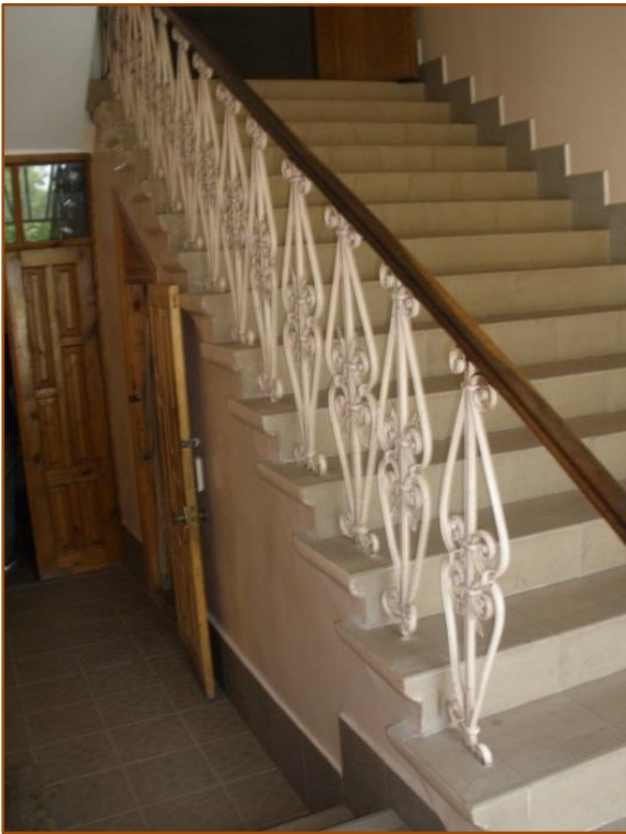
גרם המדרגות המוביל לעזרת הנשים לשעבר. המדרגות המקוריות צופו לאחרונה.