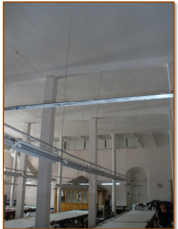
המתפרה בקומת עזרת נשים. (עמודי התמיכה העגולים הם המקוריים)