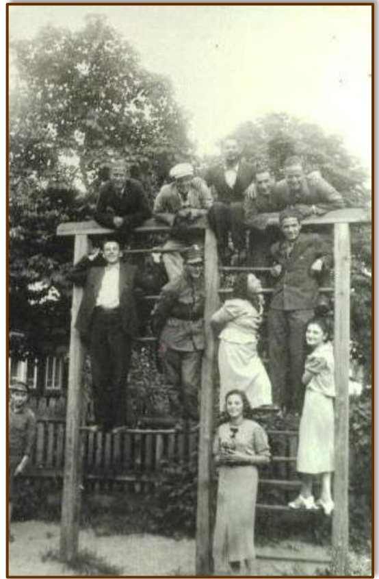
מתקני ספורט בפארק העירוני שבעיר החדשה.