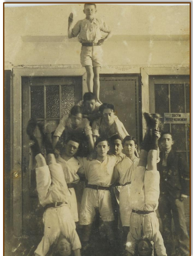
"ספורט הפירמידות" בשומר הצעיר.