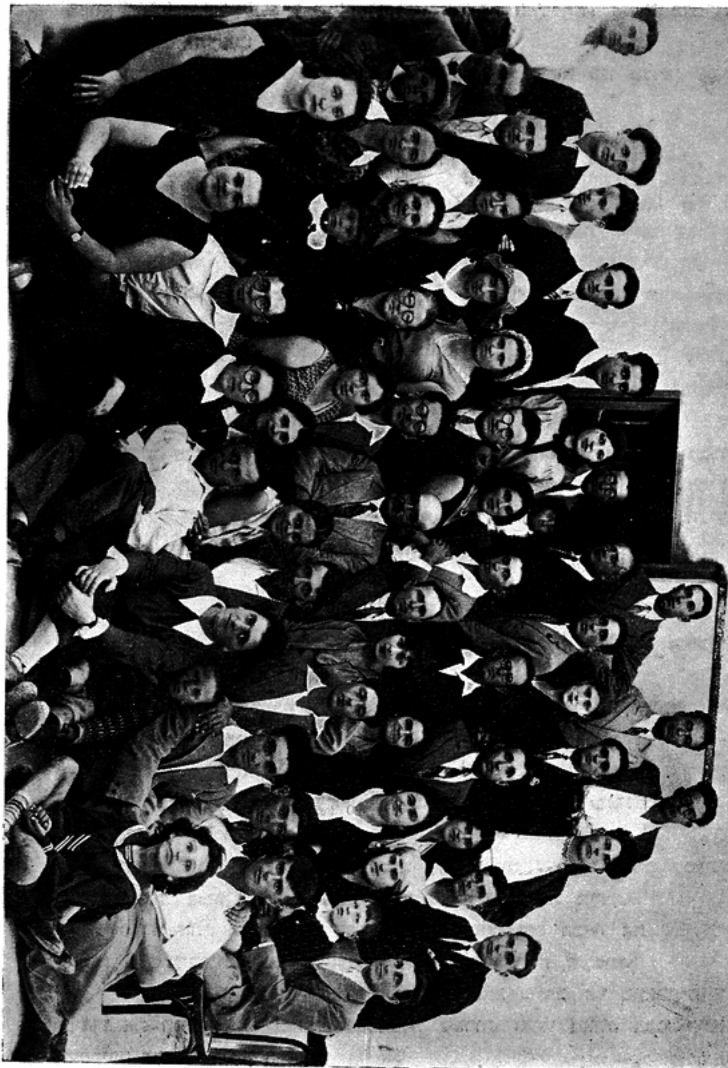
מיטת האשונה של קב"ל קוב"ל באר"י חמ"ח פסח שנת תרמ"א 4. 4. 1911