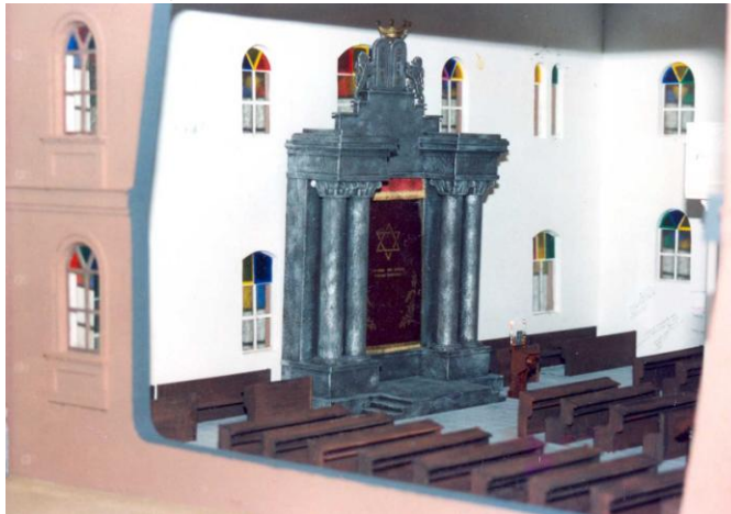
דגם של בית הכנסת הגדול בקובל מימי זוהרו. למעלה – ארון הקודש. למטה - הבימה