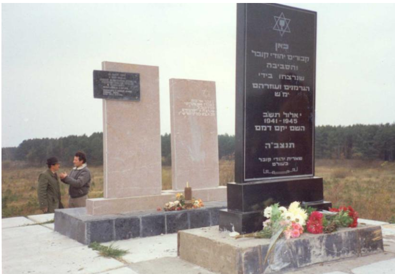
מצבות הזיכרון לקדושי קובל בגיא ההריגה ליד בכובה

כחודשיים לאחר מכן, ב-19 באוגוסט 1942 חוסלו באותה צורה כל היהודים "המועילים" מהגטו "חולות".