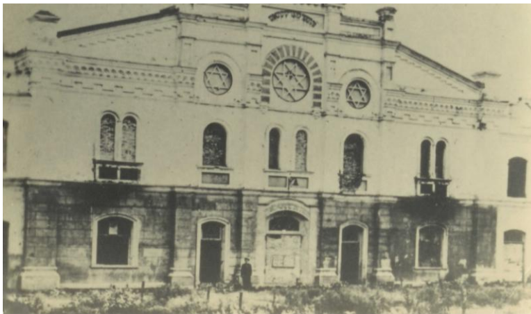
בית הכנסת של קובל כפי שנראה ב-1945. הכניסה המרכזית חסומה בקיר לבנים והמקום שימש כמזבלה לירקנים מהשוק הסמוך. בחזית עדיין נראים מגיני דווד, משני צידי "מגן שלמה" והכתובת "זה השער לה' צדיקים יבואו בו" – שכיום אינם בנמצא. פנים, נדונו השניים לעונש המכסימלי האפשרי לפי החוק הגרמני: מאסר עולם ואיבוד כל זכויותיהם האזרחיות.

כדי כך סויידו קירותיו וכל הכתובות שהיו חקוקות עליהם נעלמו מהעין. בתצלום של בית הכנסת