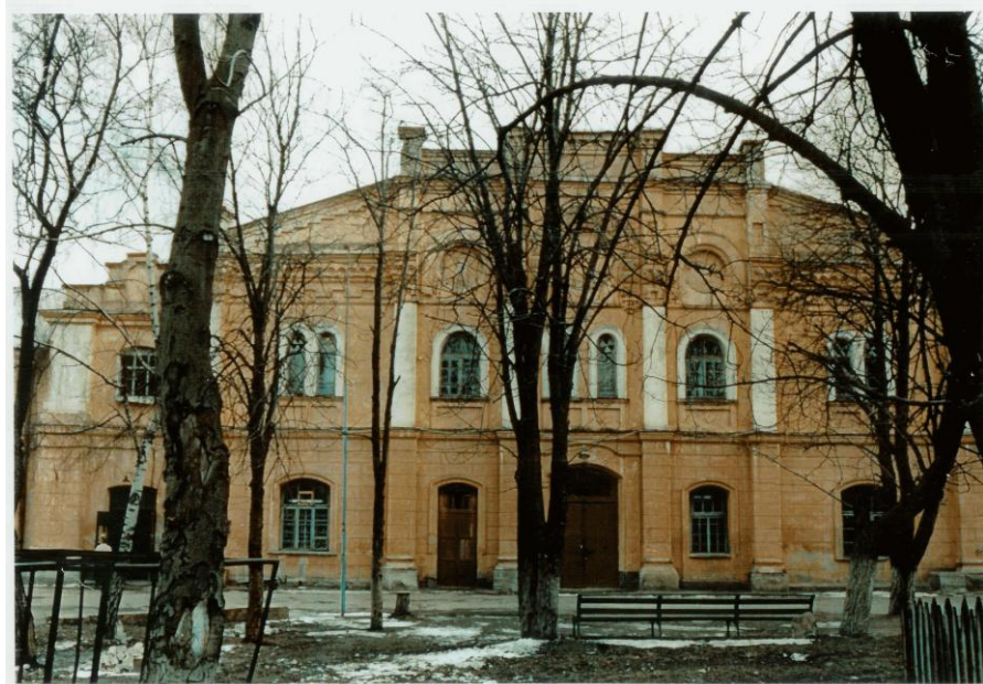
בית הכנסת הגדול של קובל, כפי שהוא נראה כיום

מיבנה שניכר בו כי פעם היה מהודר מאוד, הניצב בעיר העתיקה של קובל, מאכסן כיום מפעל הלבשה אפור. מה רב המרחק בין מה שנעשה בו כיום, לבין תחילת המאה העשרים, כאשר היה זה בית הכנסת הגדול של הקהילה היהודית התוססת בקובל. יתר על כן, מראהו השלו של המיבנה כיום אינו מעיד כלל שהיה זירה לכה הרבה סבל ובסופו של דבר מוות, של מאות ואפלי יהודים מעונים בתקופת השואה.