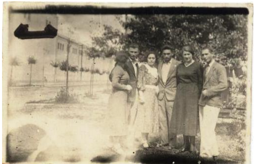
השלישית משמאל היא מורה מבית הספר העברי-עממי "הרצלייה".