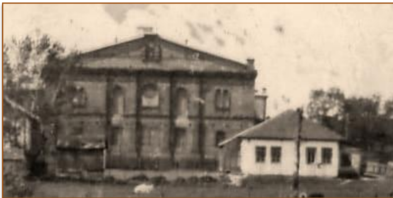
1937 לערך. המבנה הלבן הוא השטיבל. מאחוריו, קיר המזרח של בית הכנסת הגדול בקובל. (מתוך תמונה מאלבומה של מינה אורון לבית היינר)