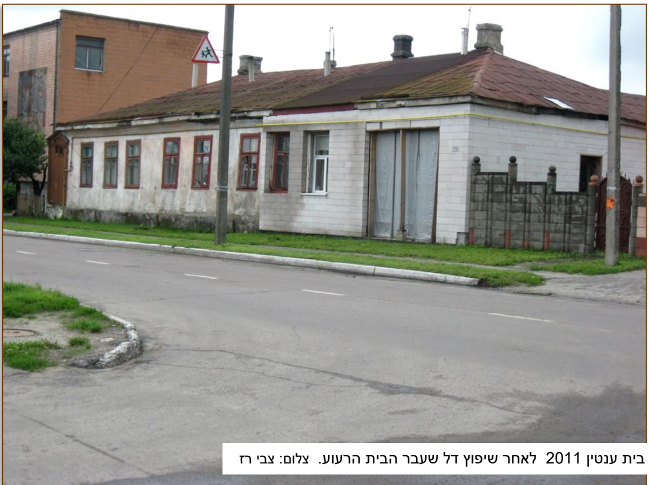
בית ענטין 2011 לאחר שיפוץ דל שעבר הבית הרעוע.