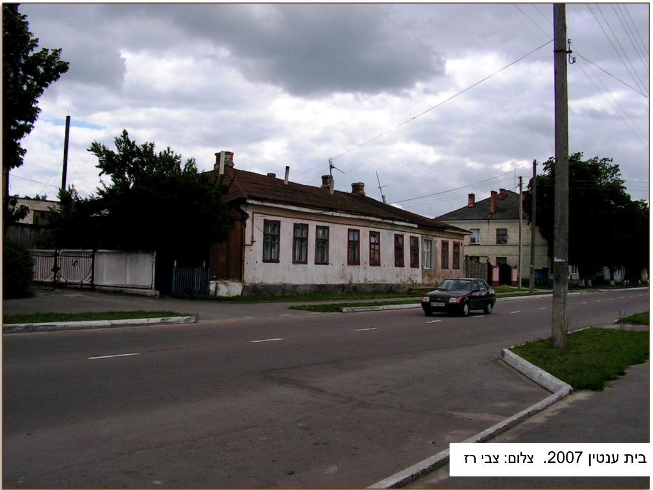
בית ענטין 2007.