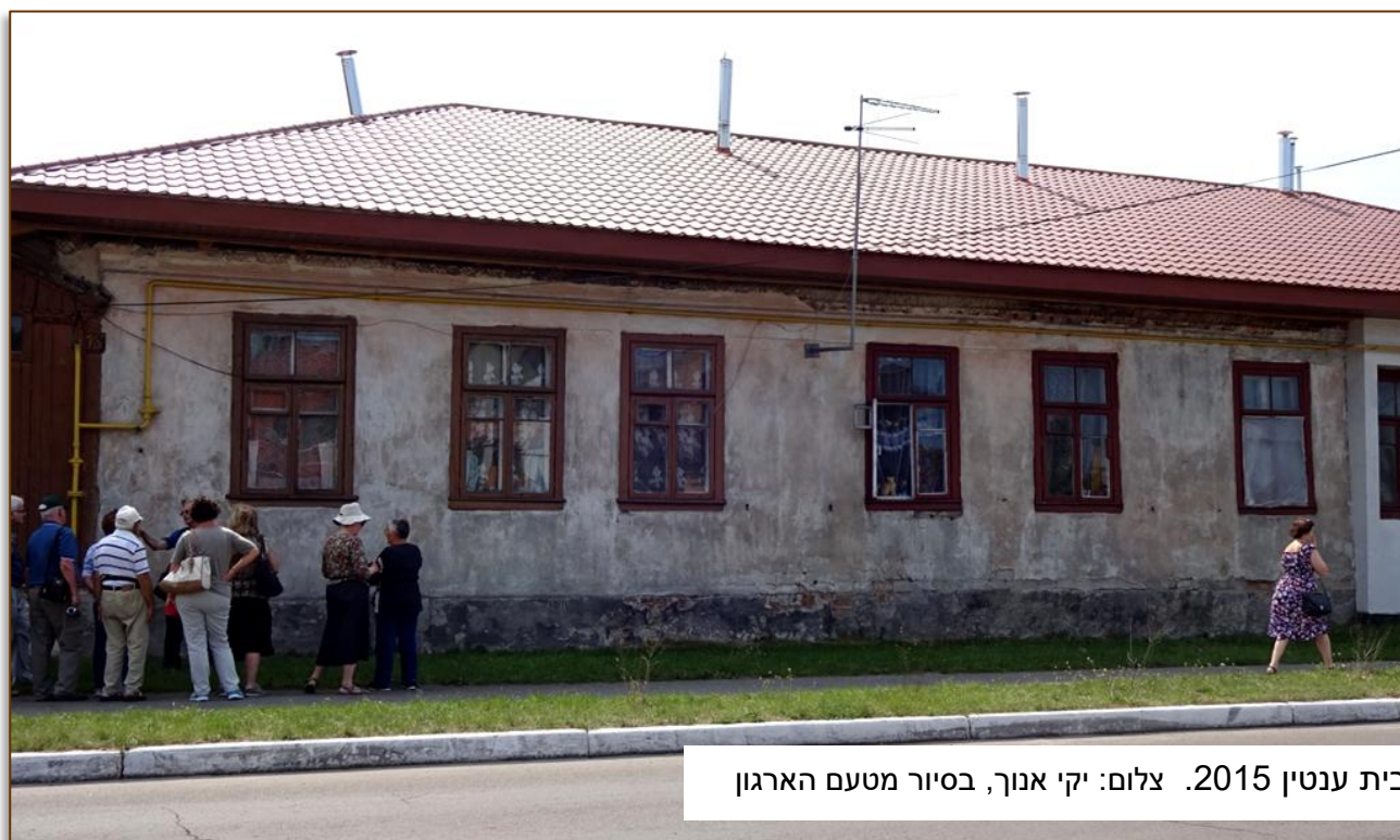
בית ענטין 2015. צלום: יקי אנוך, בסיור מטעם הארגון